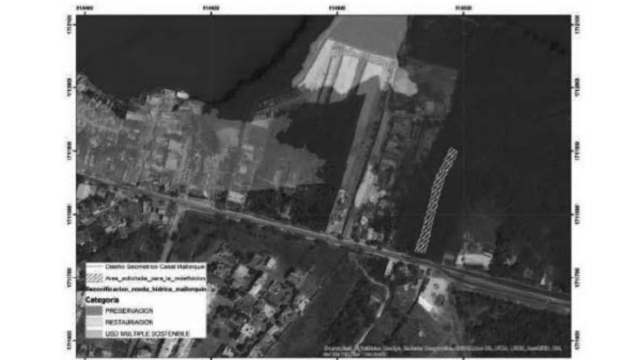
Figura 1. Área de emplazamiento del Canal Mallorquín y zonificación adoptada mediante resolución 1478 2016. Fuente Minambiente (2016) (página 15).

El artículo 14 de la Resolución 1263 de 2018, señala que el proceso de rezonificación de áreas de manglar solo es posible en el marco de “proyectos, obras o actividades de utilidad pública e interés social”, de acuerdo con la información allegada por la Corporación Autónoma Regional del Atlántico (CRA), el proyecto “Circunvalar de la Prosperidad – Unidad Funcional 6 Km 16+500 al Km 36+665”, es de Interés Nacional y Estratégico (PINES).